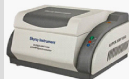
重金属測定器(上図) データシート(右図)