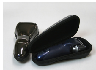
精密機器用ハードケース