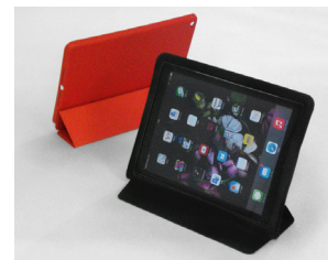
タブレット端末用カバー