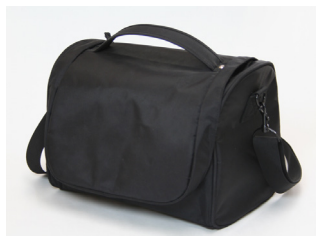
スキャナーキャリーバッグ